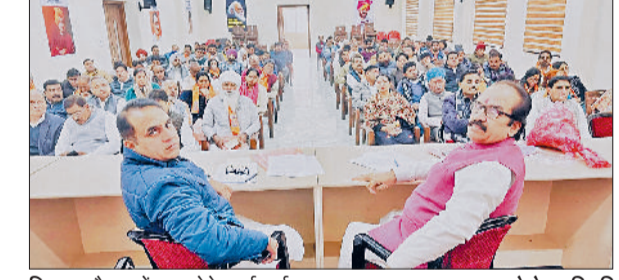
सिरसा। बैठक में भाग लेते कार्यकर्ता।