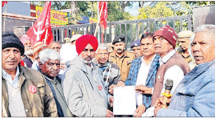
फतेहाबाद। फतेहाबाद। प्रदर्शन के बाद एसडीएम को राष्ट्रपति के नाम ज्ञापन सौंपते वामपंथी नेता।