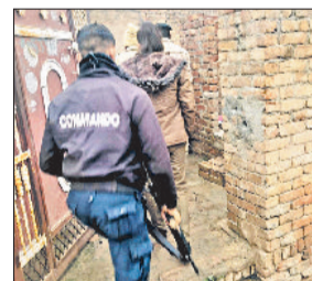
फतेहाबाद। गाँव भिरडाना में तलाशी अभियान चलाती पुलिस टीम।