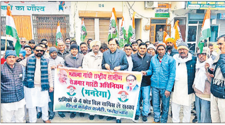
फतेहाबाद। मनरेगा को निरस्त करने के विरोध में प्रदर्शन करते कांग्रेसी।