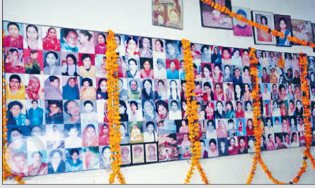
सिरसा। अग्निकांड में जान गवां चुके लोगों की याद दिलाती स्मारक में लगी तस्वीरें।

बचाव कार्य चलाया, लेकिन तब तक भारी जनहानि हो चुकी थी। हादसे के बाद स्कूल प्रबंधन, टेंट संचालकों और संबंधित जिम्मेदारों के खिलाफ मामले दर्ज किए गए। लंबी कानूनी लड़ाई के बाद पीड़ित परिवारों को मुआवजा दिया गया। यह अग्निकांड सार्वजनिक आयोजनों में सुरक्षा मानकों की अनदेखी का प्रतीक बन गया।